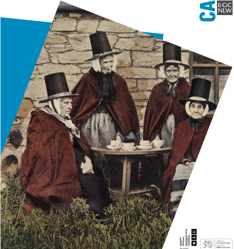
Ffoto LGC 2307 (cyfeiriad: 199600188/2) NLW Photo Album 2307