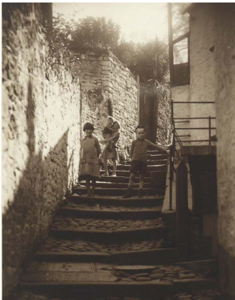
Stryd y Brenin, Aberhonddu, tua'r flwyddyn 1934 King Street, Brecon, c. 1934

Also worthy of note are the albums of postcards on themes such as actors and actresses , cats , churches and chapels etc. that have been donated to the Library over the years.