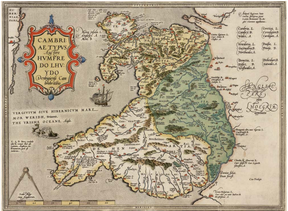
Cambriae typus gan Humphrey Llwyd, 1574, y map cyntaf o Gymru i'w brintio. Humphrey Llwyd's Cambriae typus of 1574, the first printed map specifically of Wales (map00003)