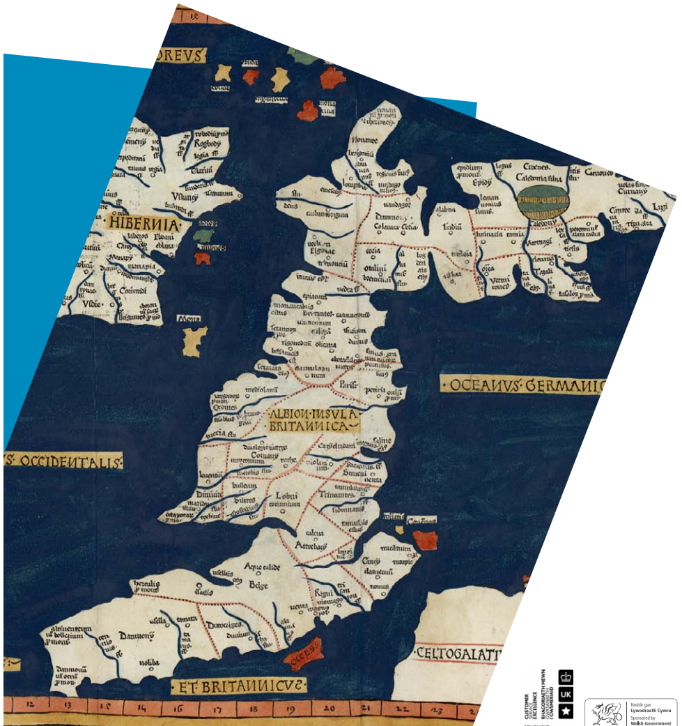
Y map hynaf yng nghasgliad y Llyfrgell, map Ptolemaidd o Ynysoedd Prydain, a brintiwyd ym 1486 The oldest map in the Library's collection, a Ptolemaic map of the British Isles, printed in 1486 (map00001)