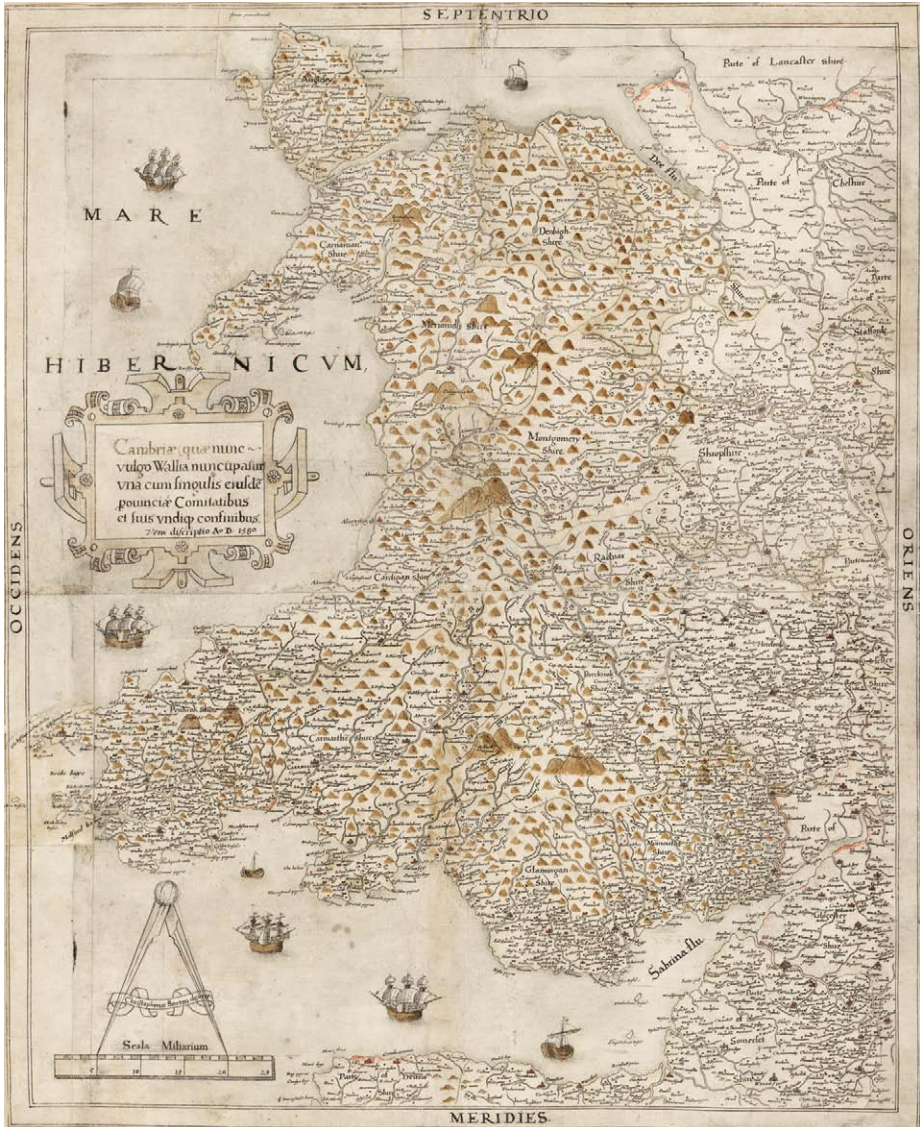
Saxton's Proof map of Wales, 1580 (map00005)