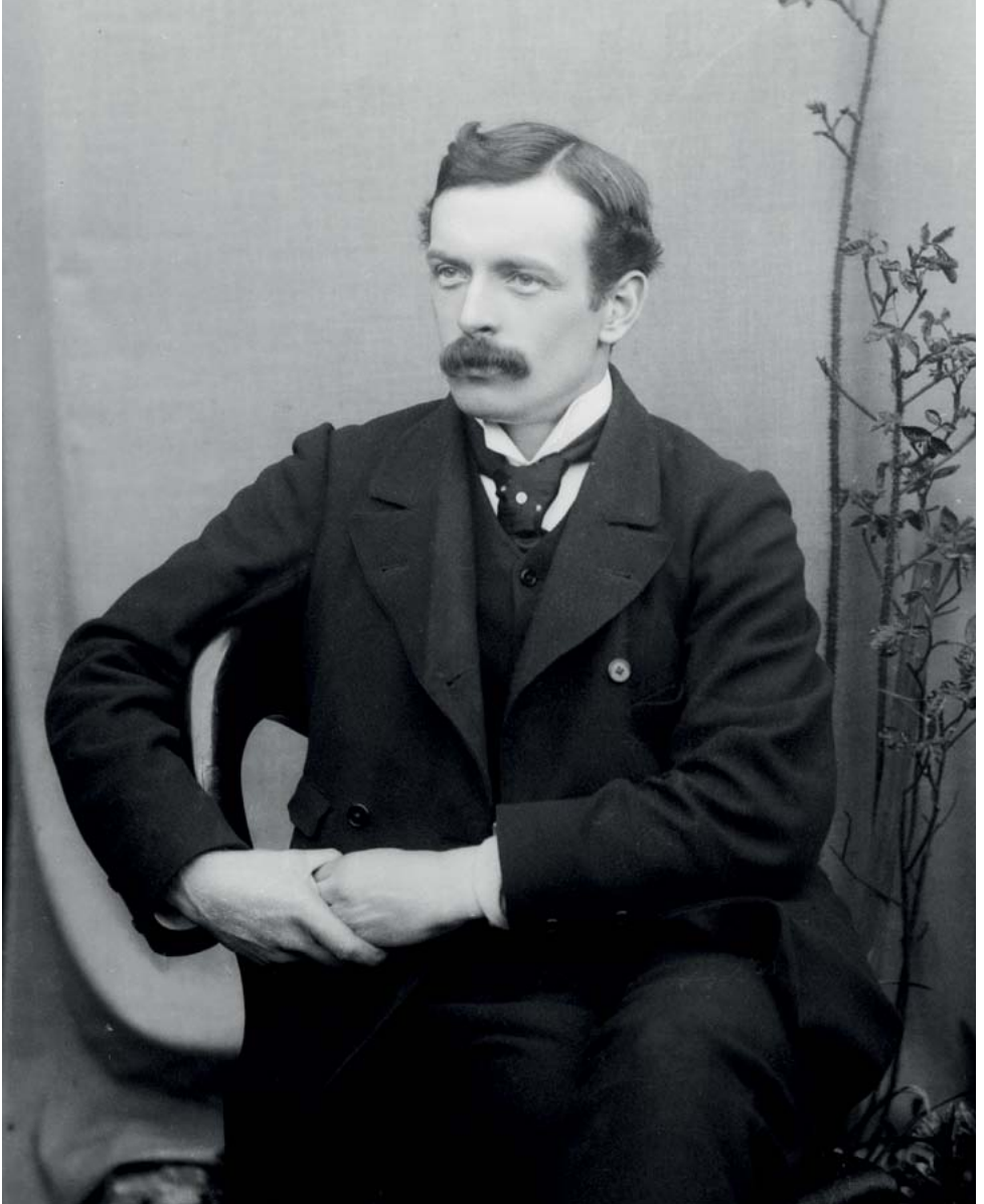
David Lloyd George (jth01581)